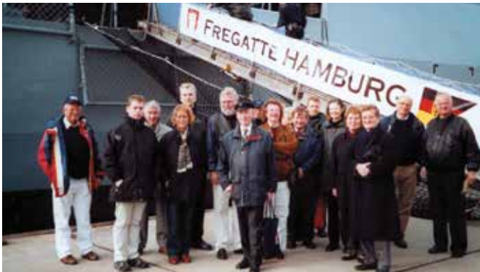
Besichtigung der Fregatte Hamburg

Wünschen wir uns, dass noch viele muntere Geburtstage auf den 40. folgen werden mit vielen anregenden und fesselnden Gesprächen und Aktivitäten. Man sagt ja – die beste Zeit im Leben ist zwischen 30 und 45. Dann können wir ja sehr gespannt sein, was uns die nächsten Jahre noch an Interessantem bringen werden.