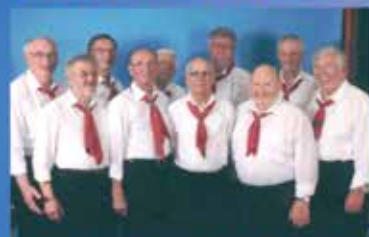
IRRENDWO AUF DER WELT...