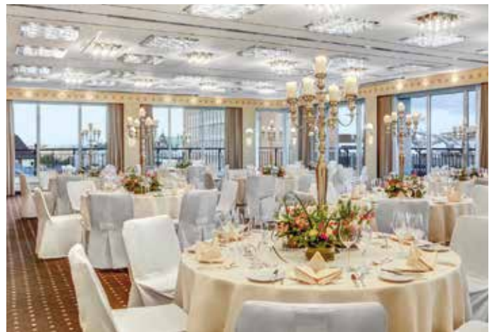
Saal "Über den Dächern Hamburgs" mit runden Tischen

Steigenberger Hotel Hamburg, Heiligengeistbrücke 4, 20459 Hamburg Tel. 040 - 85599-287