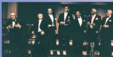
BLÜHENDE WIRTIN'S MAITING...

Die Kellermeister, das Doppelquartett aus den Reihen des Männerchors „Sängerlust“ Fleestedt, ist der Garant für gute Stimmung.