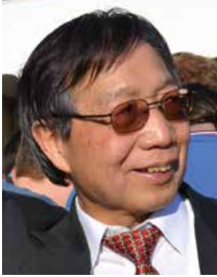
Jian-Song Chu Generaldirektor Taipeh Vertretung in der Bundesrepublik Deutschland, Büro Hamburg