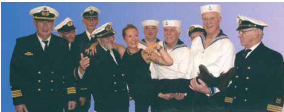
BLAUE JUNGS VON DER WATERKANT...