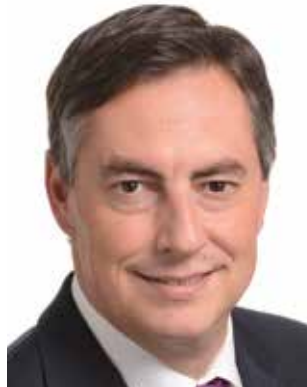
David McAllister Abgeordneter der EVP-Fraktion im Europäischen Parlament Brüssel