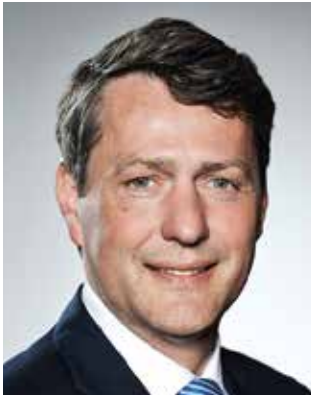
Dietrich Wersich Senator a. D. Erster Vizepräsident der Hamburgischen Bürgerschaft (CDU)